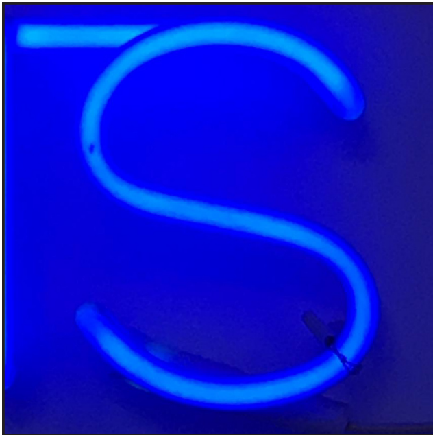
Neon Schriftzug in der Eingangshalle des Museum der Moderne.